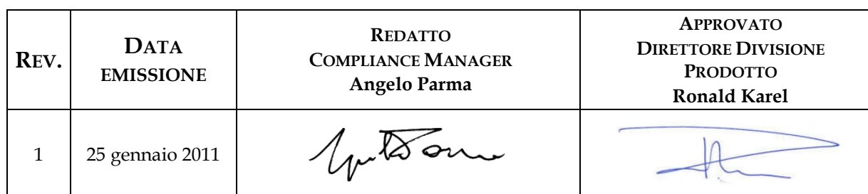
TABELLA DELLE REVISIONI